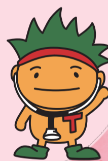
香川県 がん征圧 イメージキャラクター 「ソウキくん」